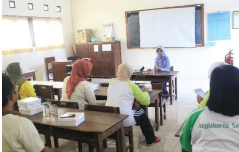
Gambar 4. Pelatihan Menggunakan Metode Ceramah

(67,86%) dinyatakan kurang, sedangkan tingkat pengetahuan dan keterampilan guru dan karyawan setelah pelatihan yaitu 26 dari 28 peserta pelatihan (92,86%) dinyatakan baik dan 2 dari 28 peserta pelatihan (7,14%) dinyatakan kurang.