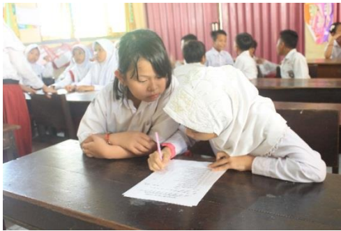
Gambar 1. Pelatihan dapat Meningkatkan Empati Siswa Berkebutuhan Khusus

evaluasi. Pengambilan data tingkat empati siswa berkebutuhan khusus dilakukan setelah pelatihan ketika dilaksanakan pelatihan. Hasil pengamatan diperoleh bahwa setelah pelatihan mitigasi bencana berbasis multisensoris, nilai empati siswa berkebutuhan khusus meningkat. Hal ini dapat disimpulkan bahwa pelatihan mitigasi bencana berbasis multisensoris dapat meningkatkan nilai empati siswa berkebutuhan khusus.