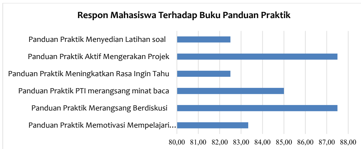
Gambar 4. Respon mahasiswa terhadap buku panduan praktik

Berdasarkan Gambar 5 menampilkan respons mahasiswa terhadap efektivitas buku panduan praktik dalam mendorong aktivitas belajar, diperoleh informasi bahwa tingkat keaktifan dan daya tarik buku terhadap pembelajaran bervariasi pada setiap indikator. Aspek yang mendapatkan skor tertinggi adalah panduan praktik merangsang berdiskusi dengan rata-rata 87,5. Ini menunjukkan bahwa buku panduan telah berhasil memfasilitasi interaksi dan diskusi antarmahasiswa, yang merupakan bagian penting dalam pembelajaran aktif dan kolaboratif. Melalui lingkungan yang mendorong diskusi dan eksplorasi sangat berperan dalam menumbuhkan kemampuan berpikir kritis, karena melalui kesempatan untuk berbagi ide, mendengarkan pendapat orang lain, dan berdebat secara sehat, anak-anak belajar menghargai sudut pandang berbeda serta membangun argumen yang lebih kuat (Armiah et al., 2025).