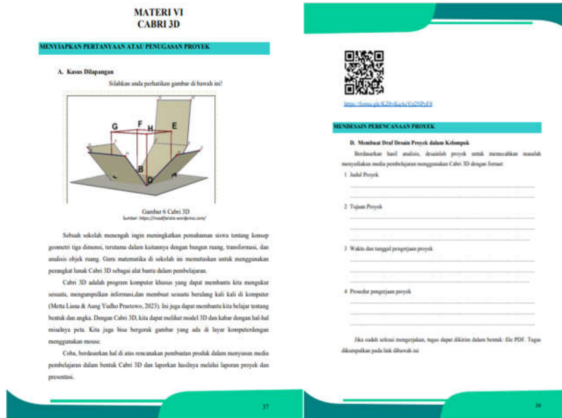
Gambar 3. Isi Panduan Praktikum

Dalam bagian ini, mahasiswa diarahkan untuk mengidentifikasi proyek yang relevan dengan penggunaan TIK dalam pembelajaran matematika, seperti pengembangan media digital. Rangkaian kegiatan disusun secara bertahap mulai dari penyusunan pertanyaan mendasar, perencanaan dan pelaksanaan proyek, hingga monitoring dan evaluasi. Karakteristik dari Project Based Learning (PjBL) mencakup kemandirian dalam menyelesaikan proyek dari awal hingga presentasi, tanggung jawab penuh dari peserta didik, keterlibatan berbagai pihak seperti teman, guru, dan masyarakat, pengembangan kreativitas, serta suasana kelas yang mendukung toleransi dan eksplorasi ide (Wahrini, 2023). Proyek ini tidak hanya mendorong mahasiswa untuk berpikir kritis dan kreatif, tetapi juga melatih kolaborasi, manajemen waktu, serta kemampuan presentasi dan refleksi.