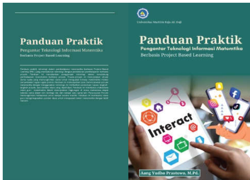
Gambar 2. Buku petunjuk praktikum

Bagian cover depan disusun dengan memperhatikan identitas akademik yang mencakup judul praktikum, nama program studi, semester pelaksanaan, serta identitas dosen pengampu dan institusi. Cover ini tidak hanya menjadi penanda administratif, tetapi juga berfungsi untuk memberikan kesan profesional dan representatif terhadap isi panduan yang disusun. Visualisasi dari cover pun dirancang dengan estetika yang formal dan sesuai dengan kaidah akademik, termasuk penggunaan logo institusi sebagai simbol otoritas.