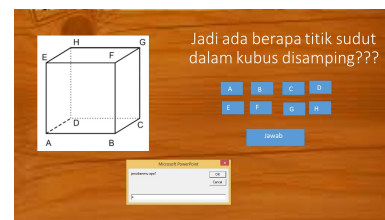
Gambar 1. Salah satu contoh kelemahan reliabilitas

Maksud dari reliabilitas dalam penelitian ini adalah program berjalan dengan baik sehingga toleransi kesalahan operasi tinggi seperti yang diungkapkan oleh (Bayram & Nous, 2004: 22). Sedangkan kelemahan yang dialami oleh calon pendidik adalah ketidaksempurnaan jalannya program misalnya penskoran dan proses input jawaban latihan soal menggunakan visual basic application. Hal ini dapat dilihat dalam Gambar 1. di bawah ini.