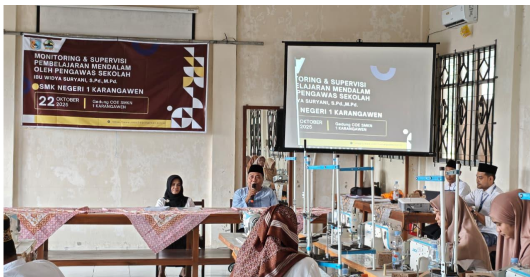
Foto 1. Pelaksanaan Kegiatan Supervisi Pembelajaran Mendalam di SMKN 1 Karangawen

Supervisi tidak hanya menjadi kegiatan pengawasan, tetapi juga wadah untuk berbagi praktik baik, saling memberi umpan balik, dan memperkuat keterampilan pedagogik. Meskipun ditemukan beberapa kendala seperti keterbatasan waktu dan variasi kemampuan dalam merancang asesmen formatif, sekolah telah tindaklanjutnya dengan kegiatan pendampingan dan pelatihan. Secara keseluruhan, hasil penelitian menunjukkan bahwa supervisi pembelajaran mendalam telah berhasil meningkatkan mutu pembelajaran dan profesionalisme guru di SMK Negeri 1 Karangawen, sekaligus memperkuat penerapan kebijakan pembelajaran vokasional berbasis deep learning .