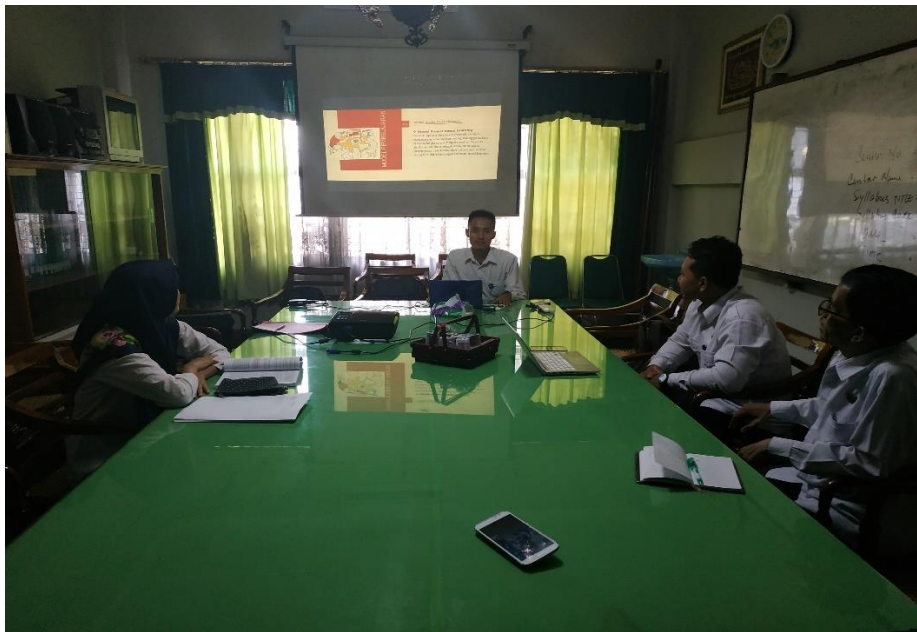
Gambar 1. Pemaparan Ketua Pengabdian Tentang Kebutuhan Mengevaluasi Pembelajaran Sejarah

yang telah diterapkan. Cara mengevaluasi yaitu harus mampu mengetahui nilai keberhasilan pembelajaran yang sudah dilakukan. Untuk bisa menilai perlu adanya penelitian yang fokus untuk mencari angka keberhasilan pembelajaran sejarah. Penelitian tersebut bisa dilakukan yaitu dengan metode kuantitatif dengan jenis survei. Penelitian survei digunakan untuk menilai hubungan variabel dependen dengan variabel independen. Pembelajaran sejarah dengan berbagai jenis metode yang sudah diterapkan merupakan variabel independen. Sedangkan hasil belajar merupakan variabel independennya. Oleh karenanya penelitian survei dianggap tepat untuk kebutuhan tersebut.