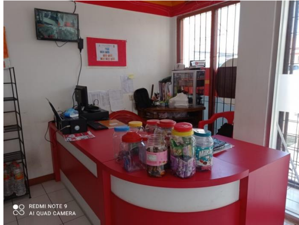
Gambar 5 Kegiatan Usaha BUMDES Abadi Jaya