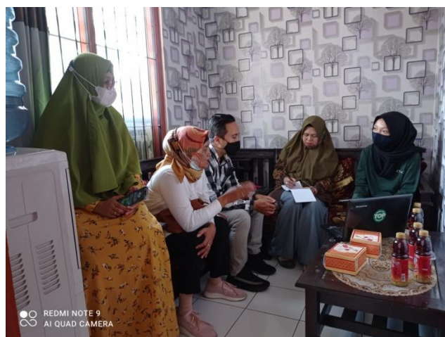
Gambar 4 Pendampingan dengan software Myob