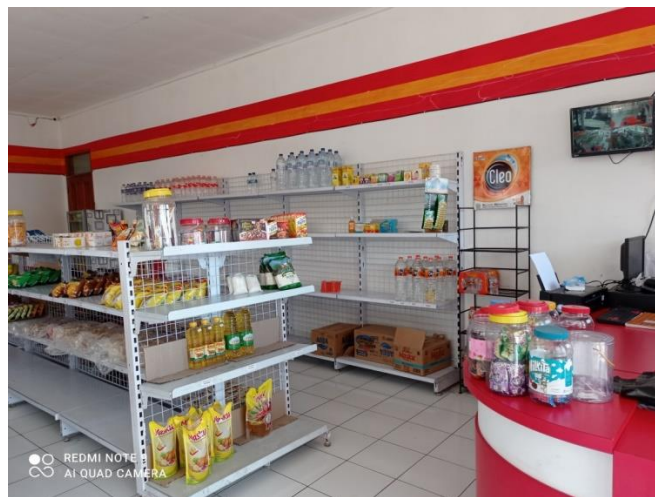
Gambar 6 Produk yang dijual di BUMDES Abadi Jaya