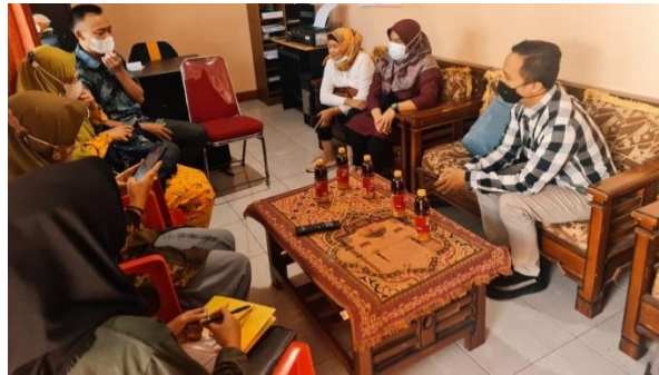
Gambar 2 Pembukaan Pendampingan PKM Pada BUMDES Abadi Jaya

pencatatan dan pelaporan keuangan BUMDES secara baik dan benar sesuai dengan SAK ETAP yang berlaku. Mekanisme pelaksanaan monitoring yang dilakukan bertujuan untuk mengetahui capaian target dari PKM melalui langkah-langkah sebagai berikut: 1). Menentukan tujuan 2). Penentuan target/sasaran 3). Penentuan perencanaan kerja, 4). Pengumpulan data, 5). Analisis data, serta 6). Penulisan kesimpulan dan rekomendasi.