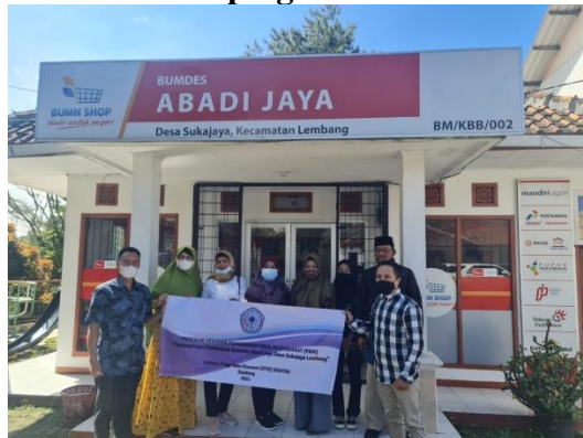
Gambar 3 Pendampingan PKM BUMDES Abadi Jaya