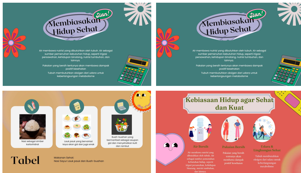
Gambar 3. Hasil Peserta Pelatihan

Dapat dilihat, bahwa para guru mengalami peningkatan pengetahuan dan pemahaman setelah dilakukannya pelatihan penggunaan aplikasi Canva untuk membuat bahan pembelajaran.