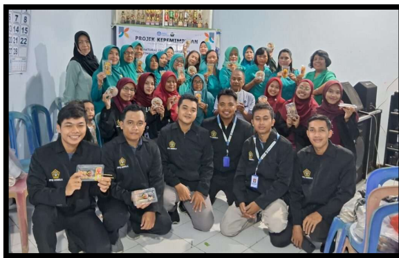
Gambar 3. Pemberdayaan Ibu-Ibu PKK oleh Tim Pengabdian Masyarakat Unissula

Hasil kegiatan menunjukkan bahwa pelatihan ini mampu meningkatkan keterampilan dan kesadaran ibu-ibu PKK dalam mengolah limbah makanan menjadi produk bernilai guna. Selain mengurangi jumlah limbah rumah tangga, kegiatan ini juga berpotensi meningkatkan ekonomi keluarga melalui peluang usaha kuliner.