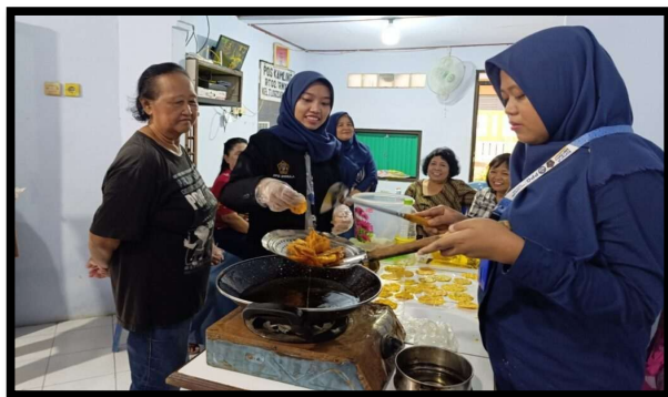
Gambar 1. Praktik Mengolah Nasi Sisa menjadi Makanan Lezat Bergizi

Berbagai hasil produk olahan yang dihasilkan oleh peserta (Gambar 1) antara lain: (a) Krupuk nasi dengan tambahan daun seledri dan bumbu rempah; (b) Empek-empek nasi dengan campuran ikan dan tepung tapioca; (c) Nugget nasi sayur yang digemari anak-anak; (d) Bola-bola nasi isi ayam dengan tepung panir; dan (e) Nasi goreng sehat rendah minyak. Produk-produk tersebut menunjukkan bahwa nasi sisa dapat diolah menjadi makanan bergizi, menarik, dan memiliki nilai jual.