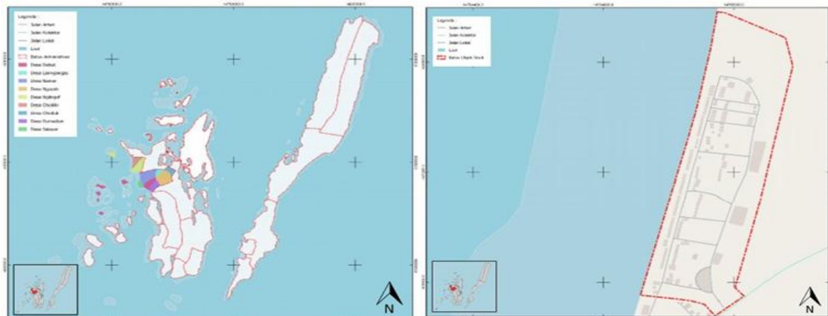
Gambar 1. Kecamatan Manuew (kiri) dan Lokasi Objek Wisata (kanan)

Data yang digunakan dalam penelitian ini terdiri dari data primer dan data sekunder. Data primer diperoleh melalui observasi langsung di lapangan dan wawancara mendalam dengan masyarakat setempat yang terlibat dalam sektor pariwisata, seperti pemilik homestay, pedagang, nelayan, dan tokoh masyarakat. Sementara itu, data sekunder diperoleh dari dokumen-dokumen pendukung seperti jurnal ilmiah, buku, laporan profil desa, data kunjungan wisatawan dari Dinas Pariwisata, serta materi promosi dan pemasaran pariwisata di media sosial dan website resmi pemerintah daerah.